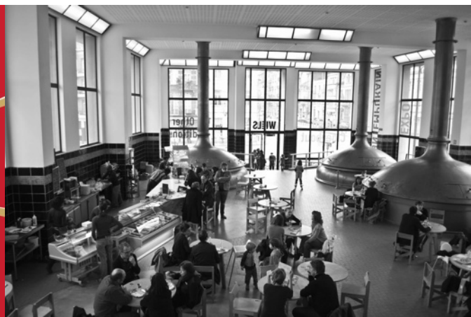
WIELS: 2005 eröffnete der Kurator und ehemalige Direktor des Münchner Kunstvereins Dirk Snauwaert die Zeitgenössische Kunsthalle mit Ateliers in einer ehemaligen Brauerei.